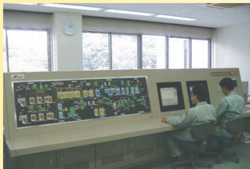
施設の運転・制御・監視を中央制御室のコンピューターで集中的に行います。