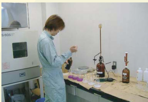
放流基準を遵守する為に、日々運転において抜き取り分析し、法令基準値以内であることを確認しています。