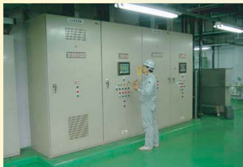
施設内の設備を毎日巡回し、異常、不具合箇所の早期発見に努め、設備の延命化に貢献しています。