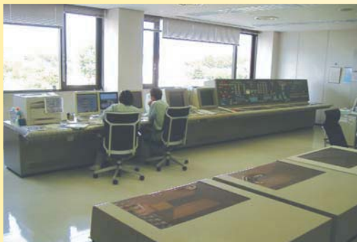
施設の運転・制御・監視を中央制御室のコンピューターで集中的に行います。