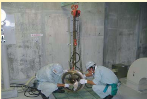
施設内の設備を毎日巡回し、不具合箇所等を点検、清掃し、整備作業を行います。