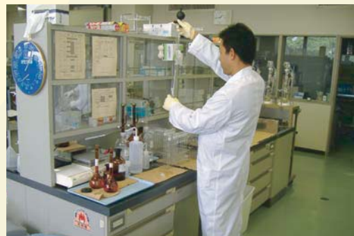
放流基準を遵守する為に、日々運転において抜取り分析し、法令基準値以内であることを確認しています。