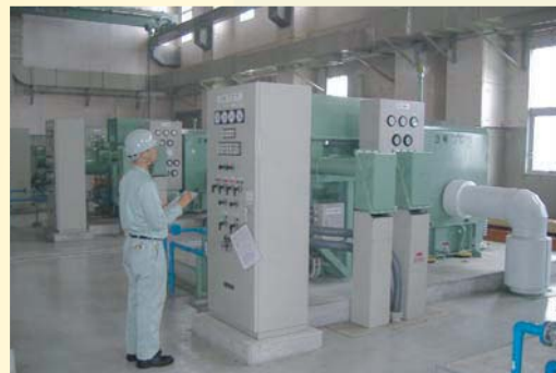
施設内の設備を毎日巡回し、異常及び不具合箇所の早期発見に努め、設備の延命化に貢献しています。